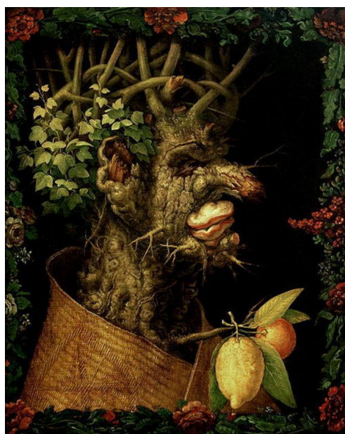
Obr. 2 – Léto , Arcimboldo, Uměleckohistorické museum, Vídeň, 1563, olej, dřevo