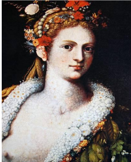
Obr. 12 – Flora I , Arcimboldo, soukromá sbírka, Stockholm, 1589, olej, dřevo