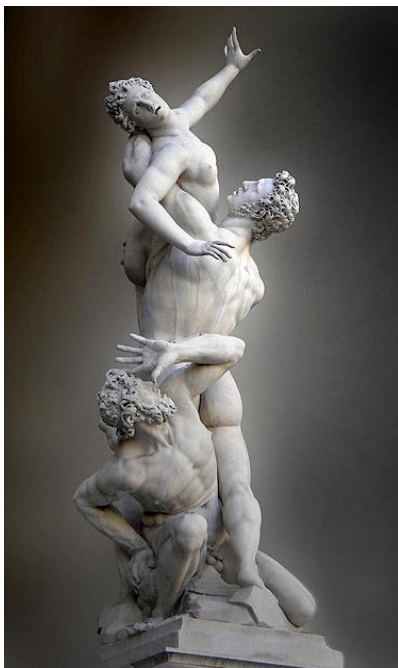
Obr. 1 Únos Sabinek , Giambologna, Loggia dei Lanzi, Florencie

Tímto pojmem poprvé definoval Giorgio Vasari 1 pozdní práce Michelangelovy, které se neshodovaly s představou renesanční harmonie. Počátky manýrismu jsou tedy patrné od konce 16. století. V malířství a sochařství manýrismu se objevuje figura serpentinata - záměrné prodlužování postav, které jsou prohnuty do esovitého postoje. Příkladem „hadovité spirály“ v sochařství je sousoší Únos Sabinek (obr. 1) sochaře Giambologni 2 . V malířství je kladen zřetelný důraz na rafinovanost, častá je asymetričnost kompozice. Modely „klasické krásy“ jsou potlačeny, tajemnost a fantastičnost výjevu je dosažena využitím chladných barev.