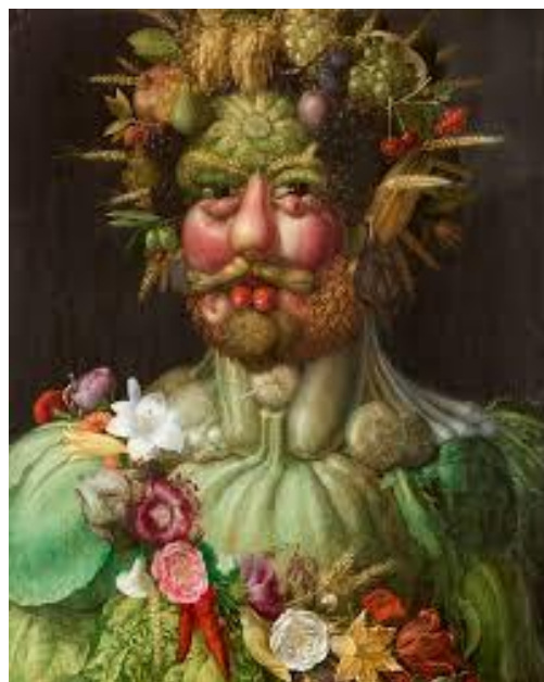
Obr. 14 – Vertumnus (portrét Rudolfa II.) , Arcimboldo, Zámek Skokloster, Švédsko kolem roku 1590, olej, dřevo

Vrcholným umělcovým dílem, které bylo vytvořeno jako pocta císaři, je obraz Vertumnus (obr. 14). Portrét Rudolfa II. jako Vertumna, římského boha ročních období, růstu rostlin a změny, skutečně vystihuje panovníkovy rysy.