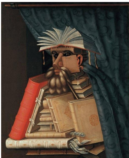
Obr. 10 – Učenec , Arcimboldo, Zámek Skokloster, 1565, olej, dřevo

Arcimboldo v této době vytvořil kompozice Kuchař, Sklepmistr, Právník. Obrazy či jejich kopie, které vznikaly pod dohledem mistra, sloužily často jako dary císaře Maxmiliána významným osobnostem. Na žádost panovníka zdoboval také konkrétní osoby, které žily na císařském dvoře. Kompozice Učenec vystihovala podobu císařova vícekancléře Johana Ulricha Zasie, pro zábavu svého císaře vytvořil také karikaturu císařského historiografa Wolfganga Lazia (obr. 10).